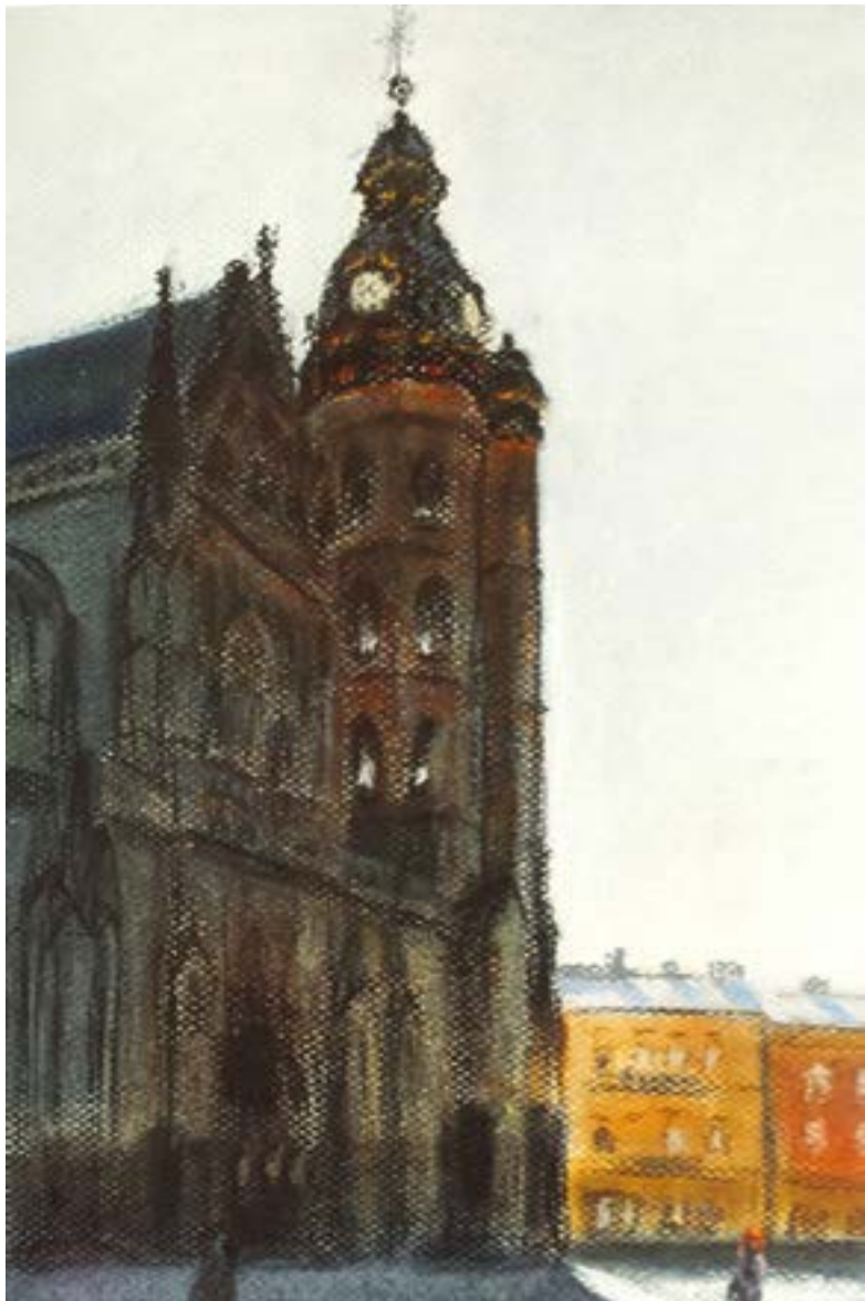
Dóm sv. Alžbety . Pastel