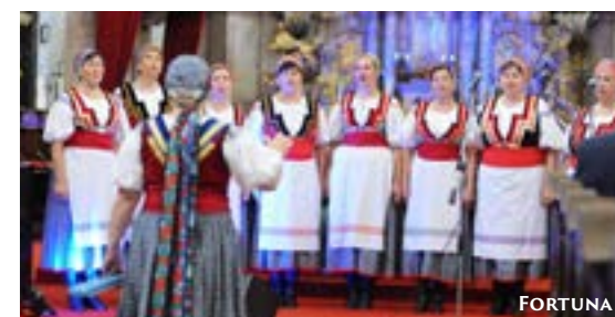
Chvála vzájomnosti 2019