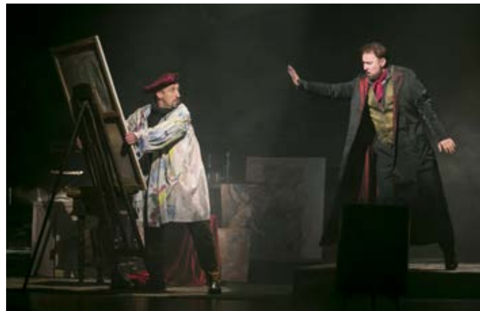
Bohéma . Štátne divadlo Košice