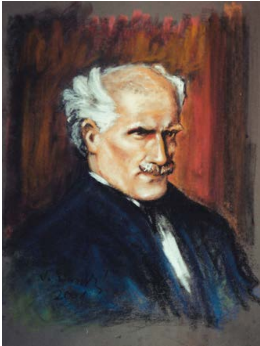
Arturo Toscanini . Pastel