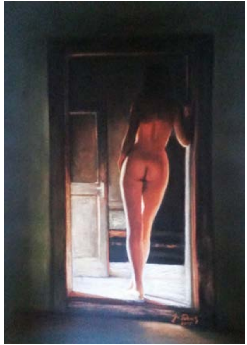
Ráno . Pastel