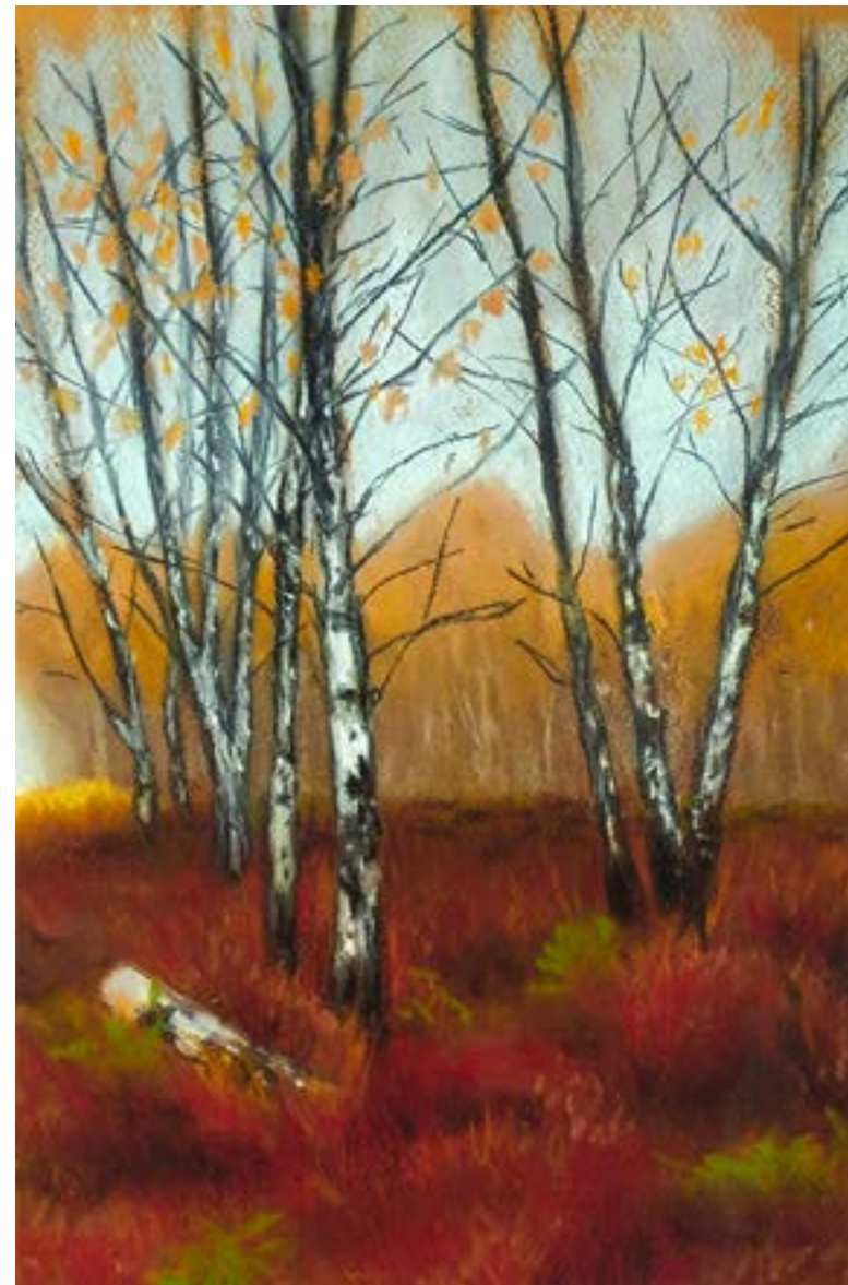
Opiná . Pastel